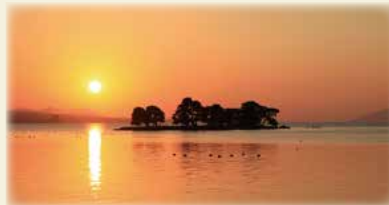
宍道湖に浮かぶ嫁ヶ島と夕日