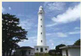
石造灯台としては日本一の高さを誇る日御碕灯台