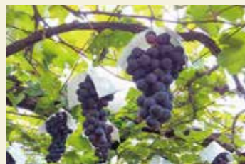
大社観光ぶどう園で美味しいぶどうをどうぞ

※新型コロナウイルス感染症により、観光施設開館・イベント開催状況は変更になる可能性があります。