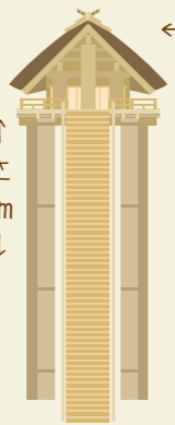
←古代出雲大社 本殿