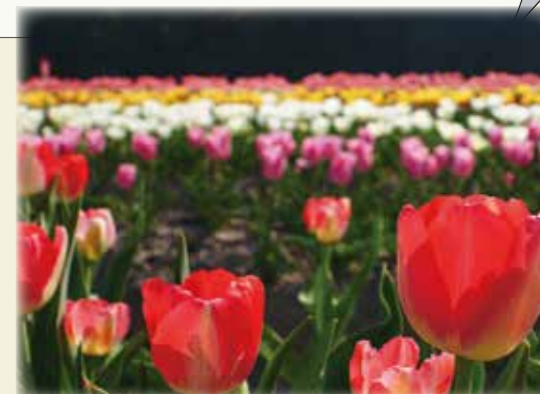
チューリップ畑 (安来市伯太町)