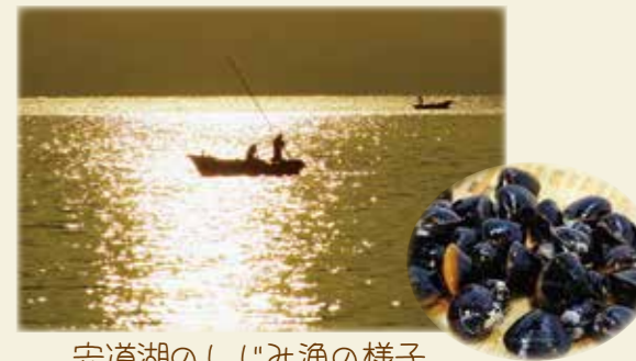
宍道湖のしじみ漁の様子